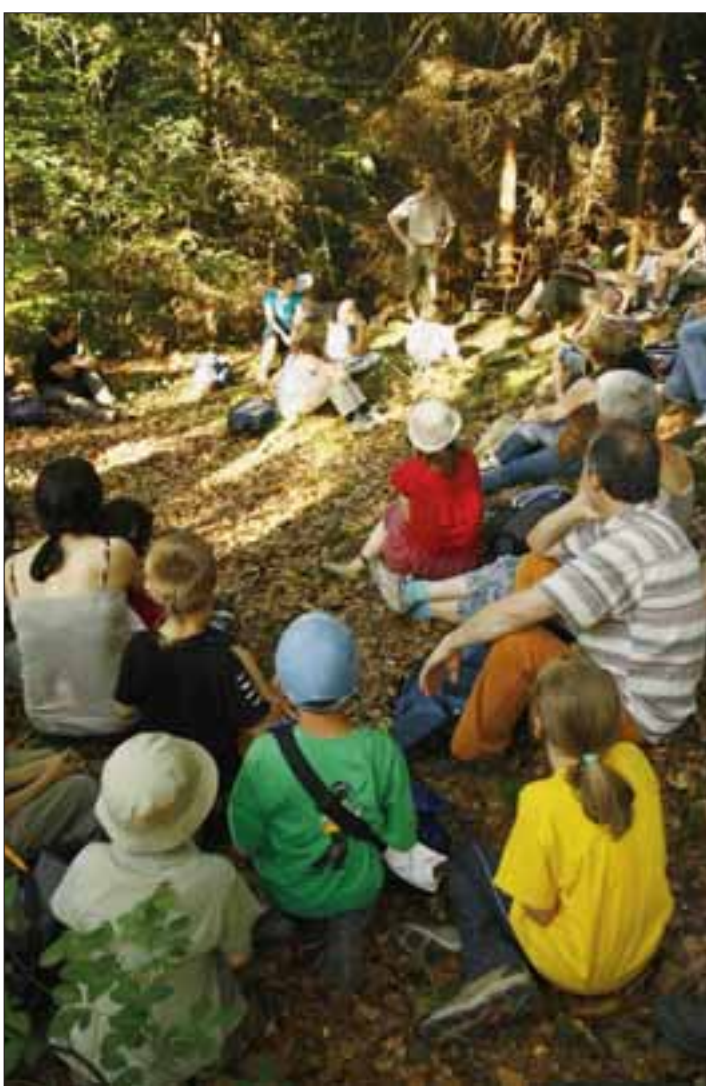
CADRE NATUREL Pour raconter les merveilles de la forêt, l'amicale «Auprès de mon arbre...» propose une soirée de contes en plein air. (LDD)

Pour connaître le lieu précis de rendez-vous, il faut impérativement s'inscrire au tél. 032 484 90 03 ou 079 227 42 38 (le soir) ou par e-mail à: info@aupres-de-mon-arbre.ch